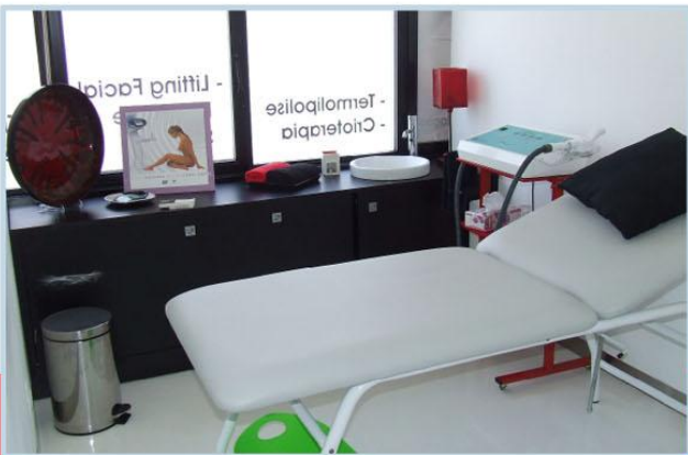
Interior dos Centros Cellulem Block